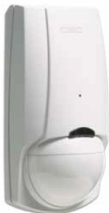
Patrón de Cobertura